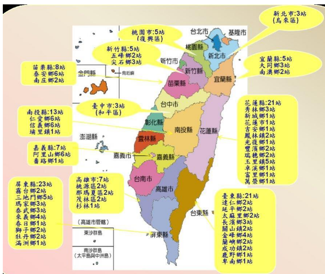
圖 4.1.1 全國 106 年度本會設置 121 個部落文化健康站分佈圖

另 121 個文化健康站所在部落有 22 個同時有本會補助沉浸式幼兒園計畫，其中有 4 個文化健康站所在部落(南投仁愛鄉中原部落、屏東縣三地門鄉安坡部落、瑪家鄉中村部落及玉泉部落)同時有沉浸式幼兒園計畫及學生課後扶植計畫。另，有 3 個文化健康站所在部落(新竹縣尖石鄉馬里光部落、高雄市杉林區大愛部落及屏東縣泰武鄉佳平部落)同時有互助式教保服務中心，本計畫以臨近、重疊原住民托育(沉浸式幼兒園計畫及互助式教保服務中心)及學童課後扶植地點的部落優先整建。